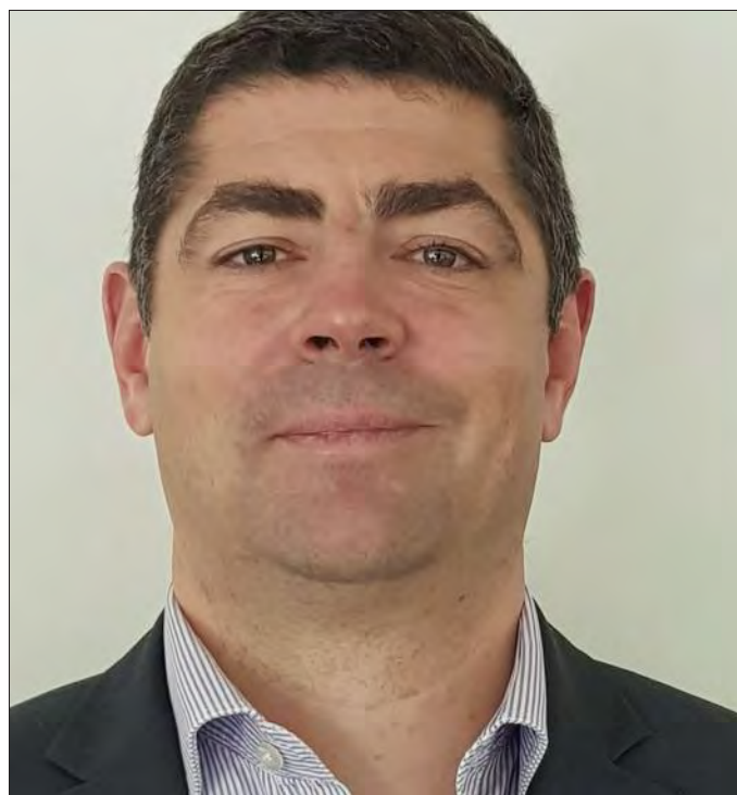
« Nous développons la prise en charge des pathologies de la vieillesse »

Nous avons aussi créé une hotline pour que les médecins de ville se mettent en relation avec nos médecins en cas de demande d'hospitalisation. Nous avons également ouvert un service de chimiothérapie, pour soigner ces pathologies qui sont malheureusement en forte croissance. »