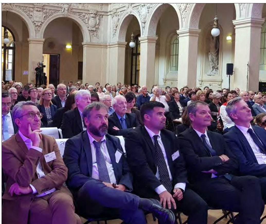
De nombreuses personnes étaient présentes à cette quatrième édition.

L'occasion d'honorer huit lauréats pour des réalisations concrètes ou des projets qui permettent d'améliorer la pri-