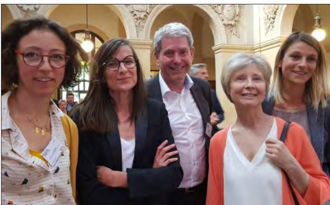
L'équipe de l'association gestionnaire du Réseau Régional de Rééducation et de Réadaptation Pédiatrique en Rhône-Alpes (R4P).

Directeur du Centre Léon Bérard, le professeur Jean-Yves Blay a rappelé lors d'une intervention durant la soirée, que « le centre qui traite 30 000 patients atteints de cancers par an dispose de tous les outils diagnostic et thérapeutiques. Nous sommes un centre intégré de cancérologie avec toutes les disciplines et tous les niveaux de prise en charge, de la prévention au protocole post-traitement. » « La prévention, a-t-il souligné, est une des missions du centre. Cela va de la prévention primaire avec les recommandations au grand public à la prévention secondaire et tertiaire en cas de récurrence pour prévenir l'émergence d'un deuxième cancer ». Ainsi, une salle de sport a été ouverte pour habituer les patients à une meilleure hygiène de vie.