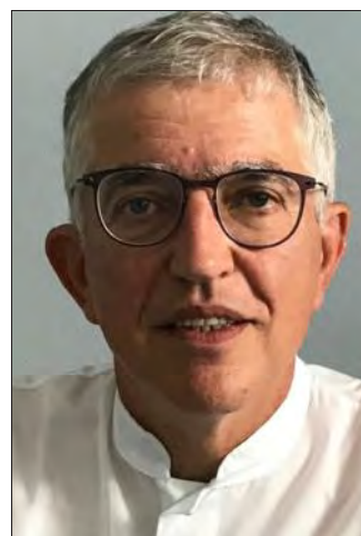
Le Professeur Norbert Nighoghossian.

La prise en charge des AVC est également associée à un enjeu majeur de prévention des récurrences par le contrôle des facteurs de risque en particulier de la fibrillation auricu-