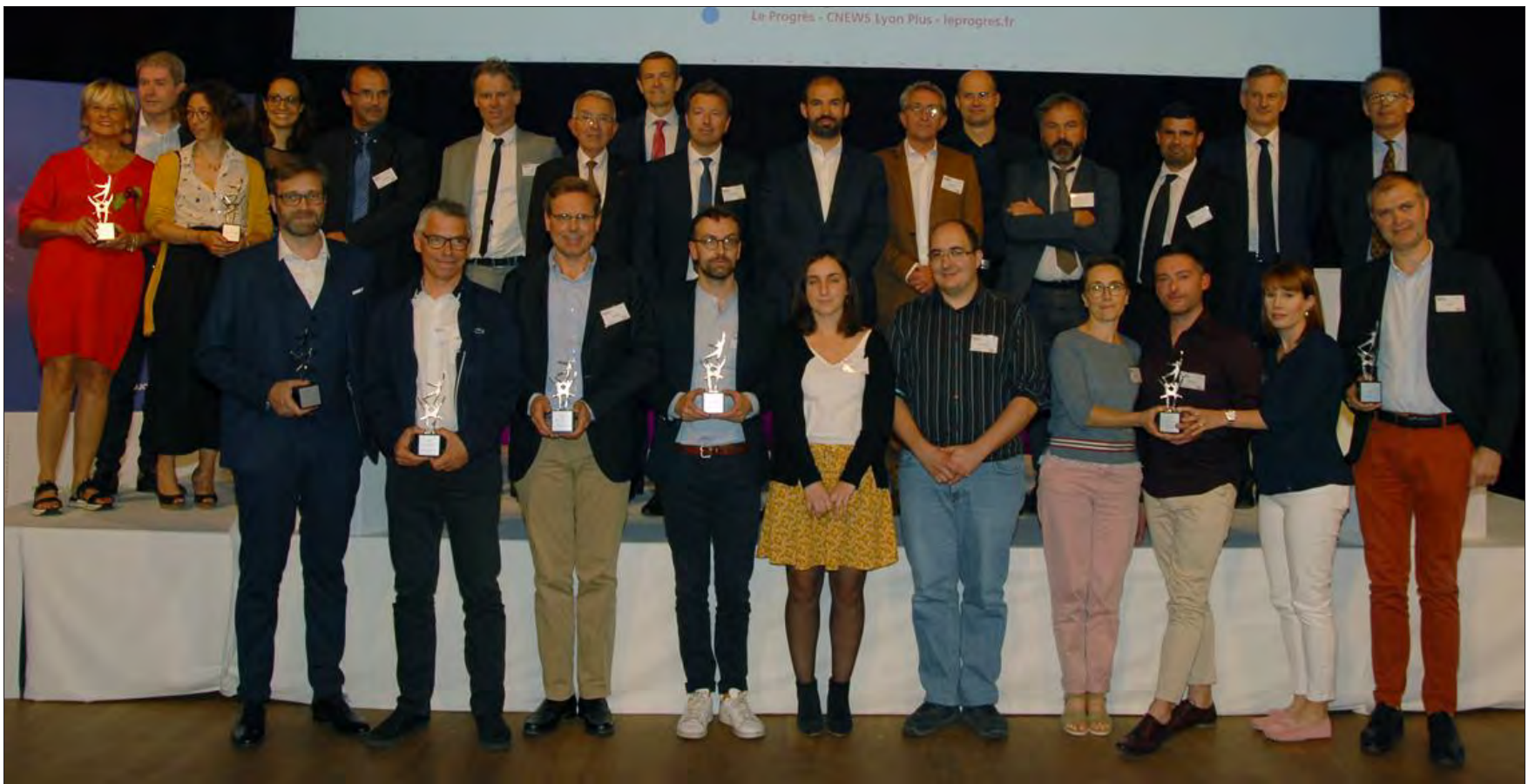
Les lauréats et les partenaires, ensemble sur scène, à l'issue de la cérémonie, qui s'est tenue ce mercredi 12 juin au Palais de la Bourse de Lyon.