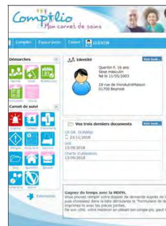
Compilio, le carnet de santé informatisé.

fant dans son quotidien, comme les enseignants, les éducateurs spécialisés, par exemple. L'objectif est de mettre en commun les compétences et les informations dont chacun dispose, pour que l'enfant soit suivi dans les meilleures conditions. Cela permet aussi à ces futurs adultes de garder une trace de leur histoire médicale.