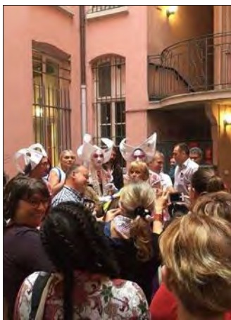
L'inauguration du centre le 27 mai 2016.