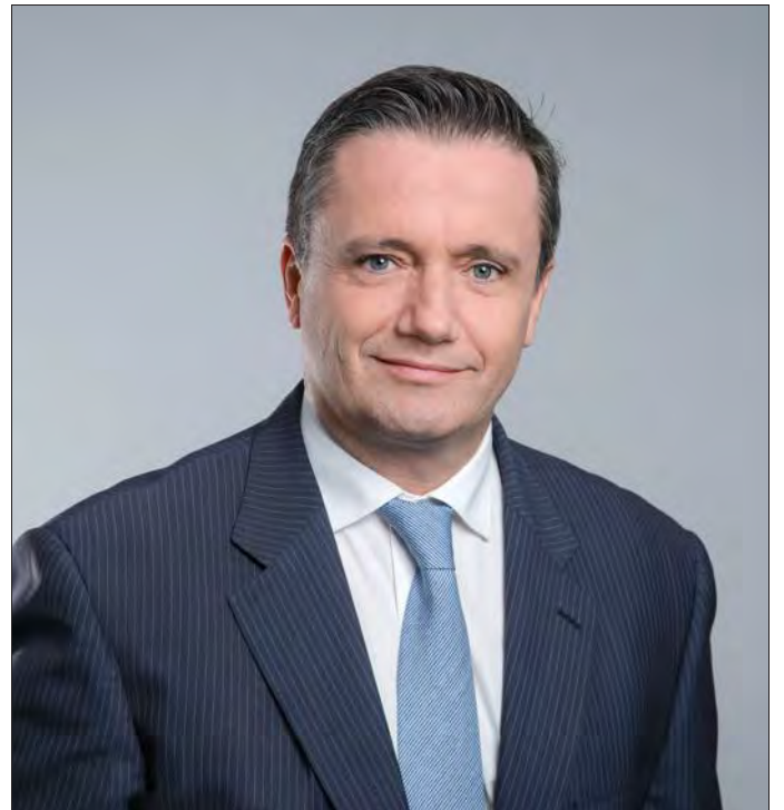
« Une part de notre mission est d'accompagner le patient dans son parcours de santé tout au long de sa vie. »

Lyon accueillera d'ailleurs en septembre prochain une exposition originale sur ce sujet. Nous soutenons également des entrepreneurs sociaux qui inventent des solutions et des services nouveaux pour les patients à travers notre programme « Healthy Lyon ». En partenariat avec Ronalpia et le Centsept, il a permis d'accompagner six entrepreneurs sociaux depuis deux ans. »