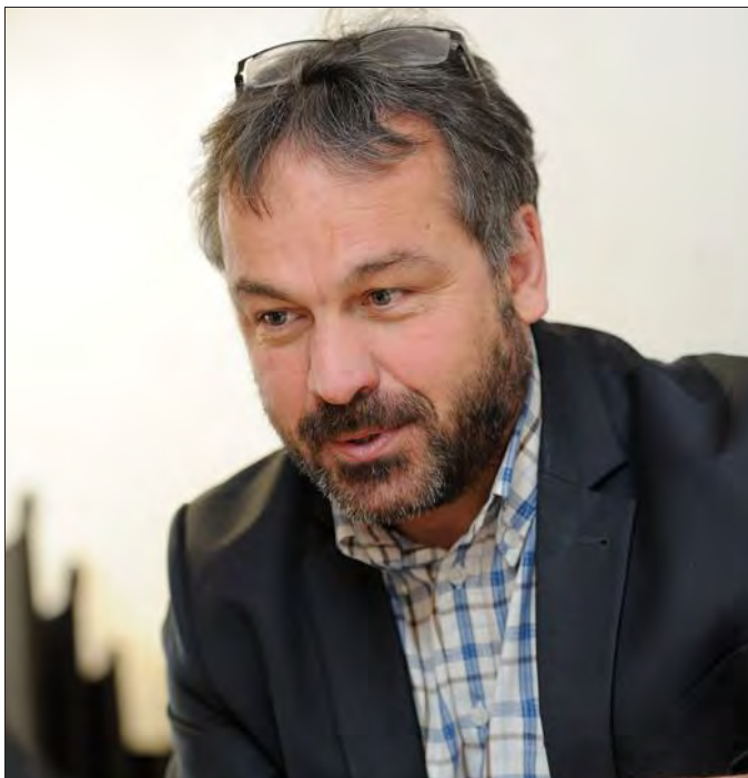
« J'attends que le lauréat apporte une réelle plus-value en matière de santé, particulièrement auprès de publics dits « empêchés ».