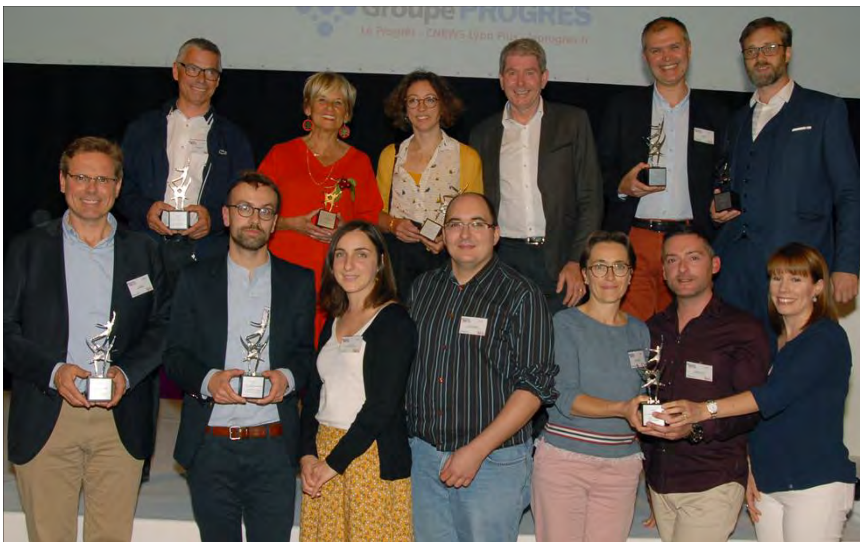
Les lauréats de cette édition 2019 des Trophées de la Santé, qui a eu lieu ce mercredi 12 juin au Palais de la Bourse.